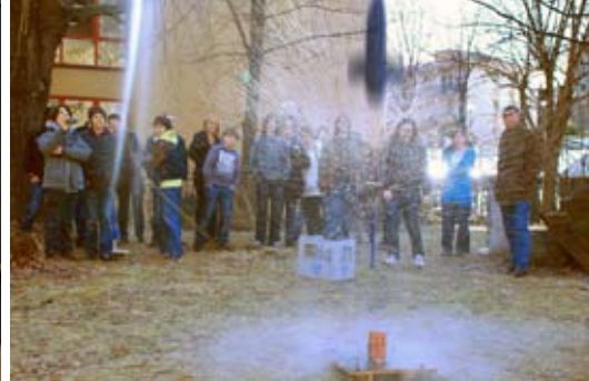
Start der Wasserraketen