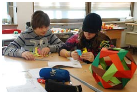
Geometrische Körper flechten