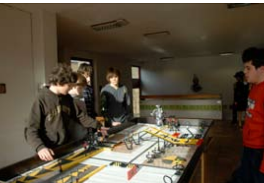
Lego Mind Storm