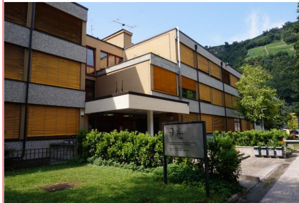
Realgymnasium und Technologische Fachoberschule Meran