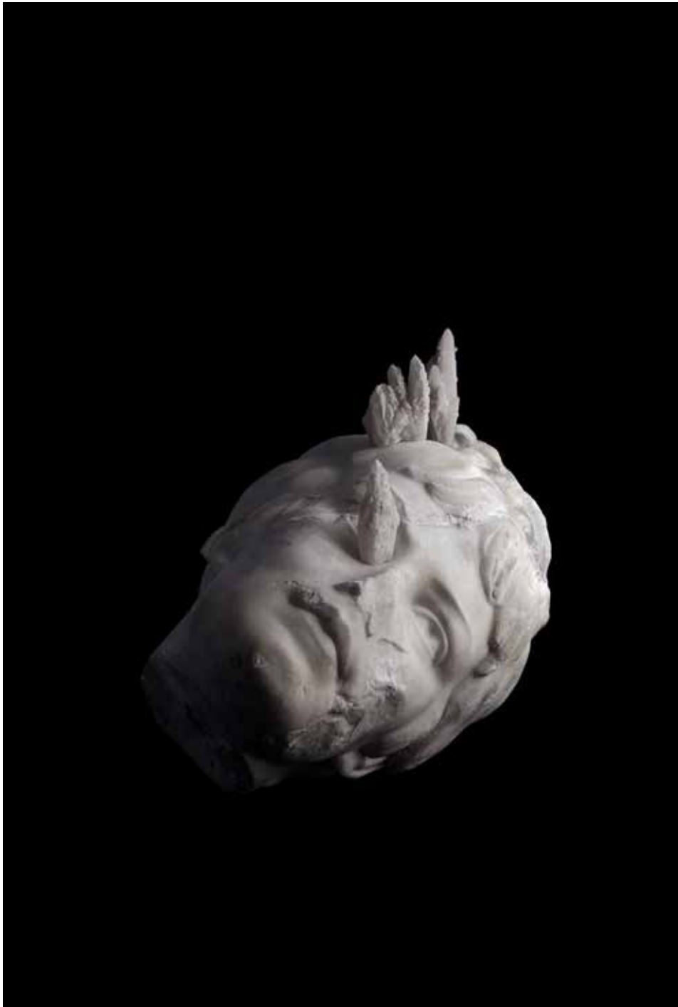
Sissa Micheli, Tears of the Past, 2019. Archivfester Pigmentdruck, variable Größe