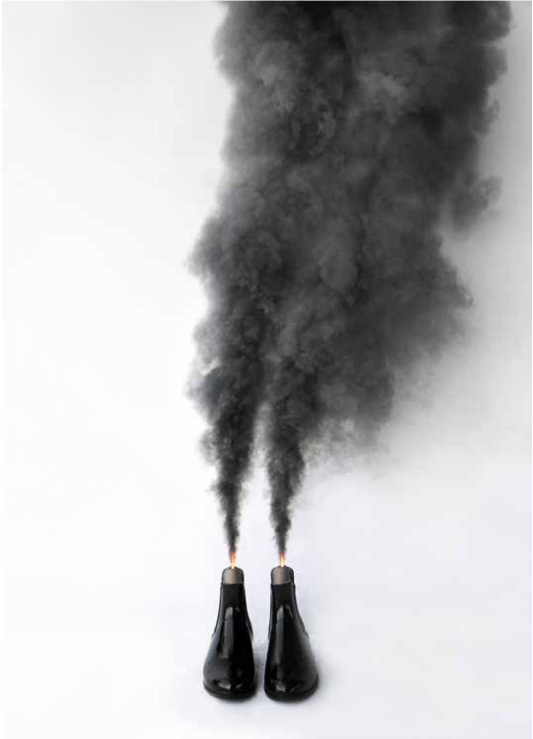
Sissa Micheli, Rocket Ghost, 2020, Archivfester Pigmentdruck, variable Größe.