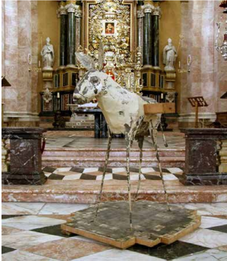
Trasporto straordinario asinello