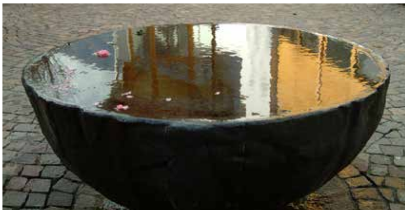
Brunnen in Tschirlan